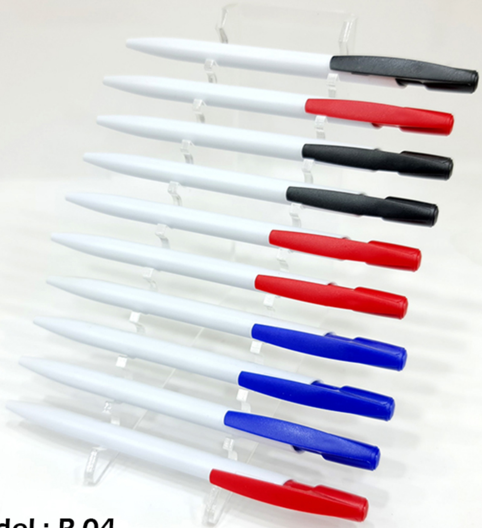
Model : P-04