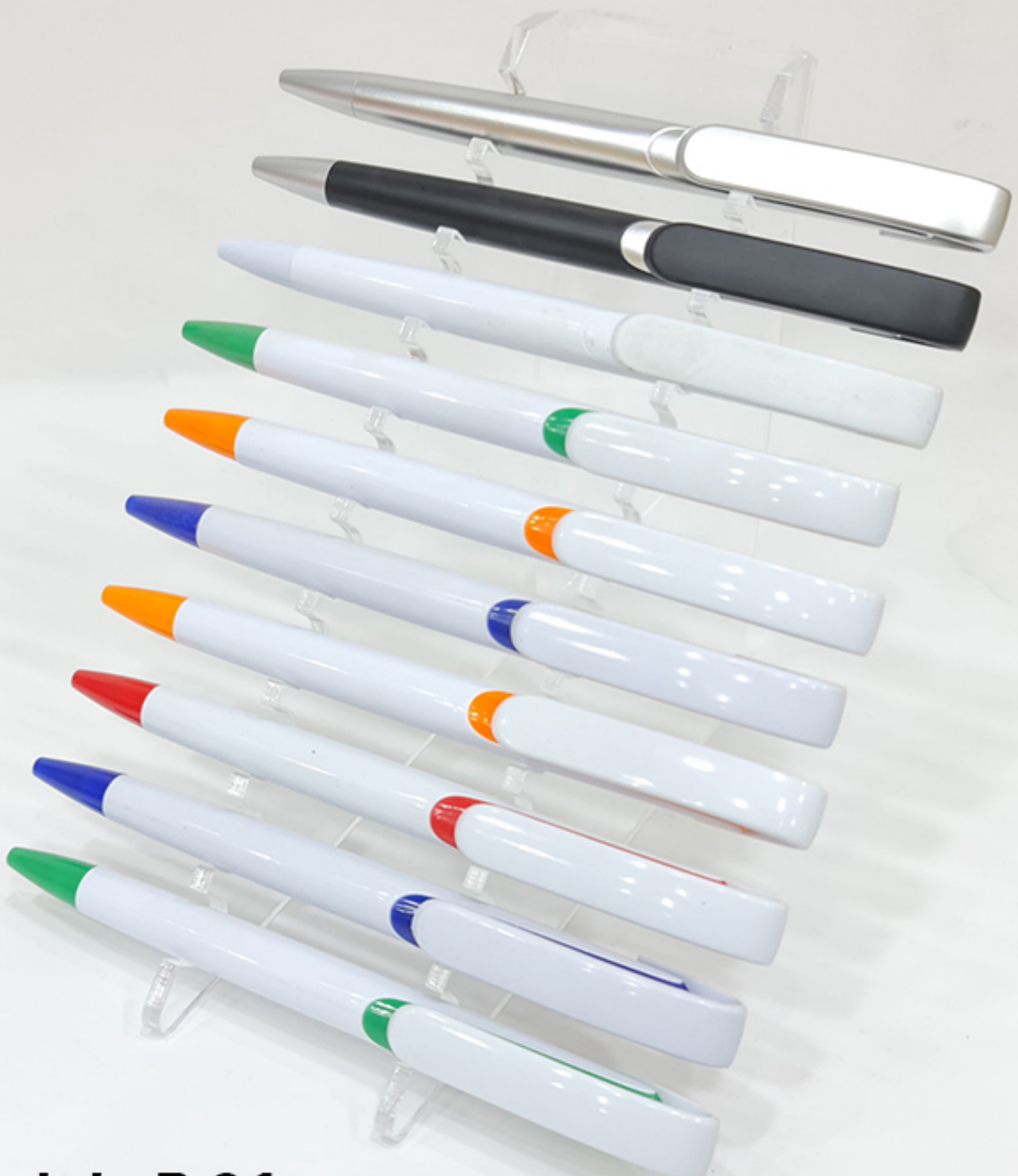
Model : P-01