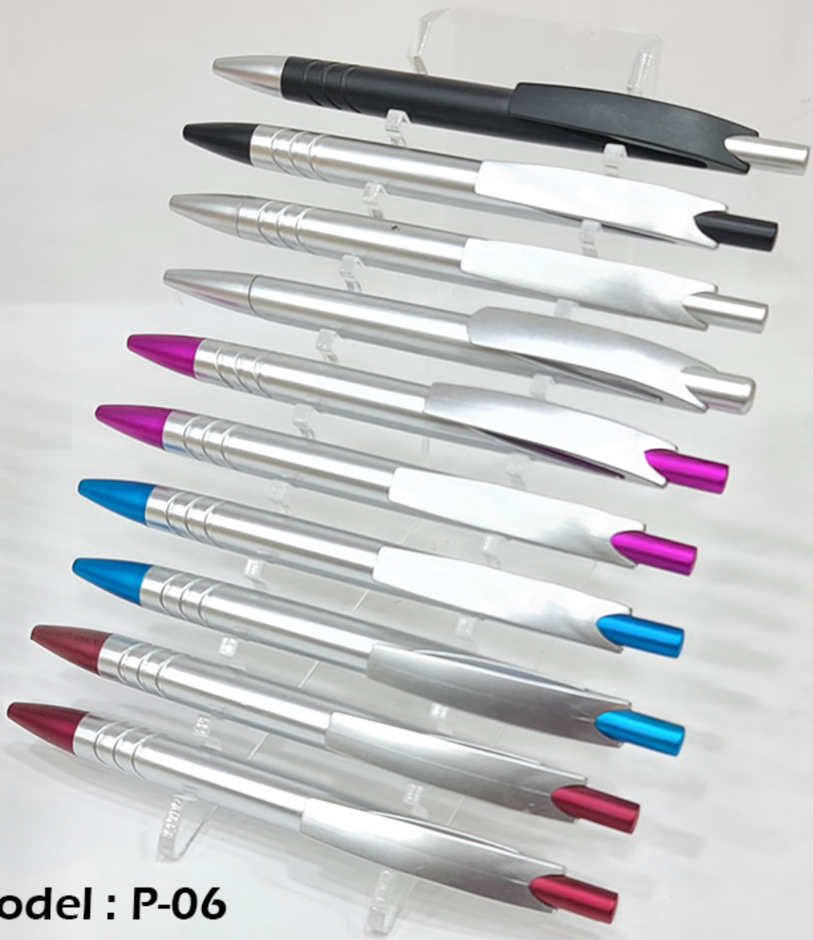
Model : P-06