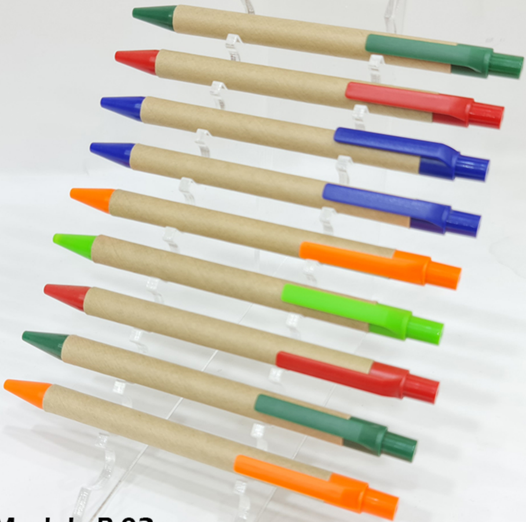
Model : P-02