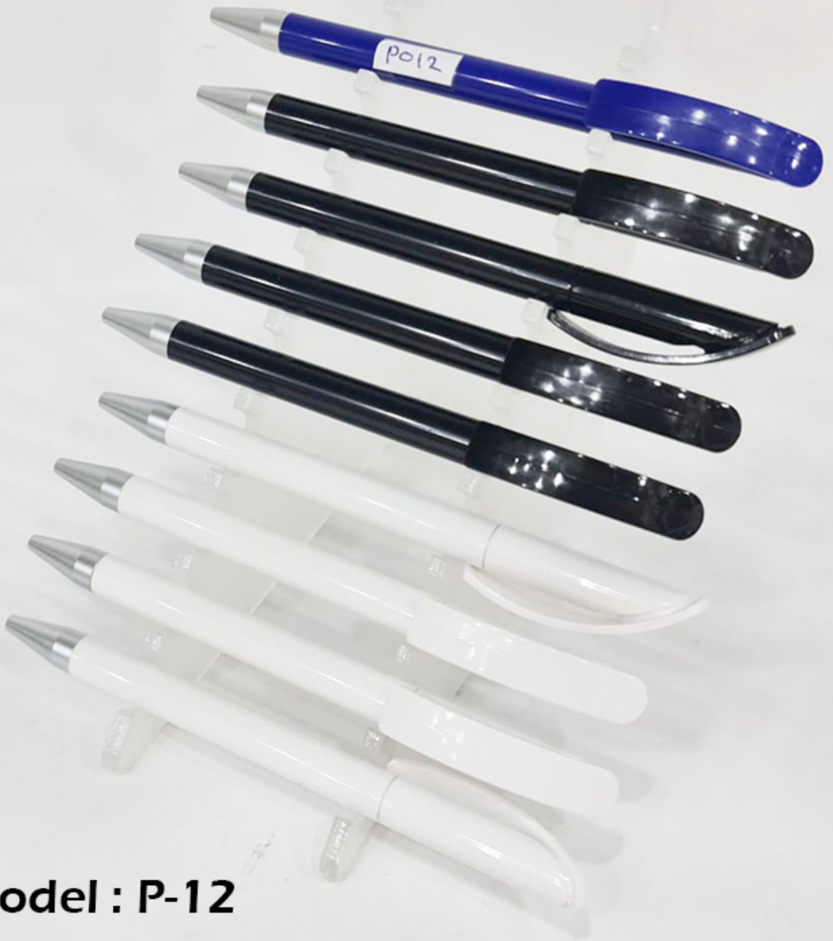
Model : P-12