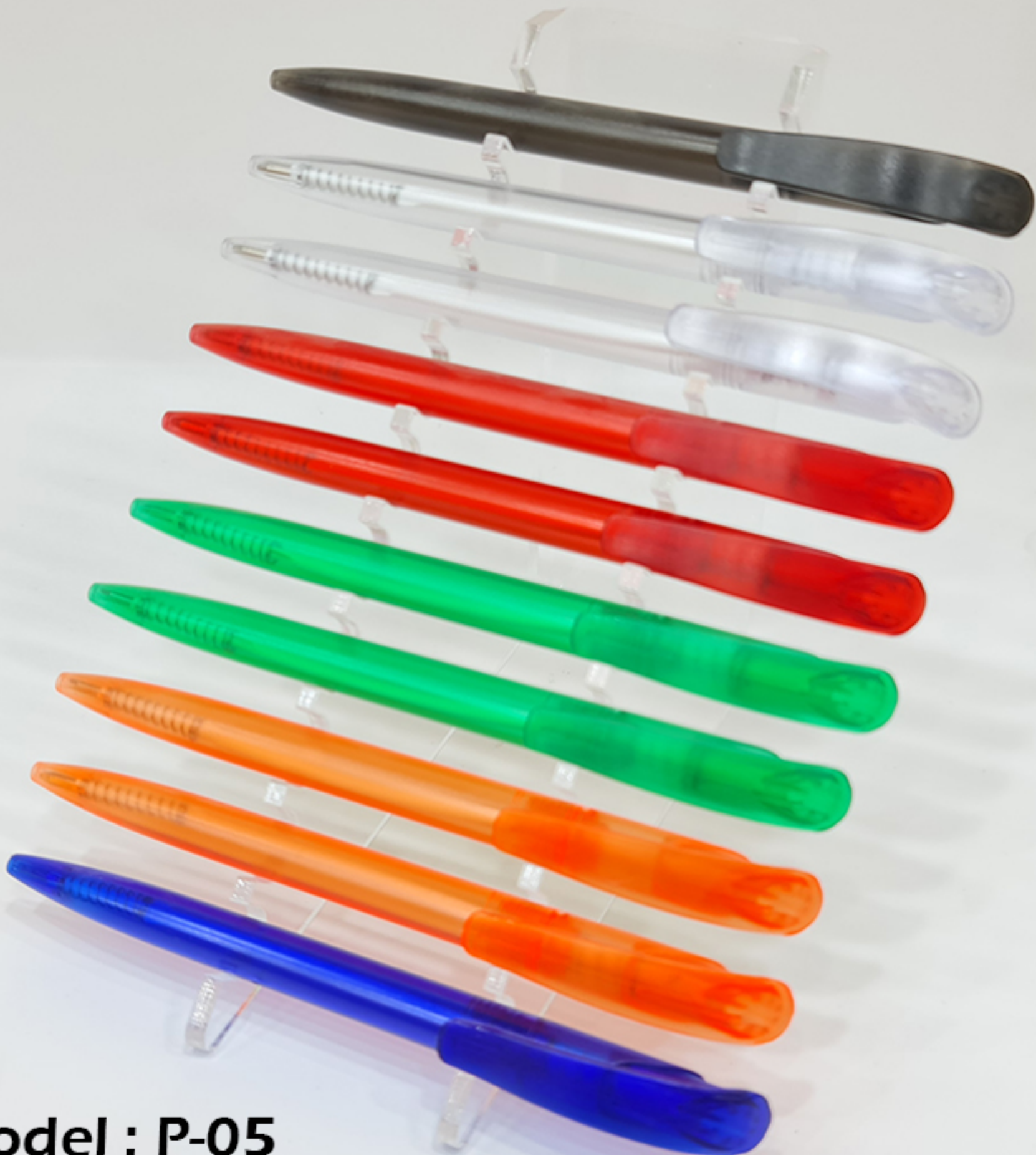
Model : P-05